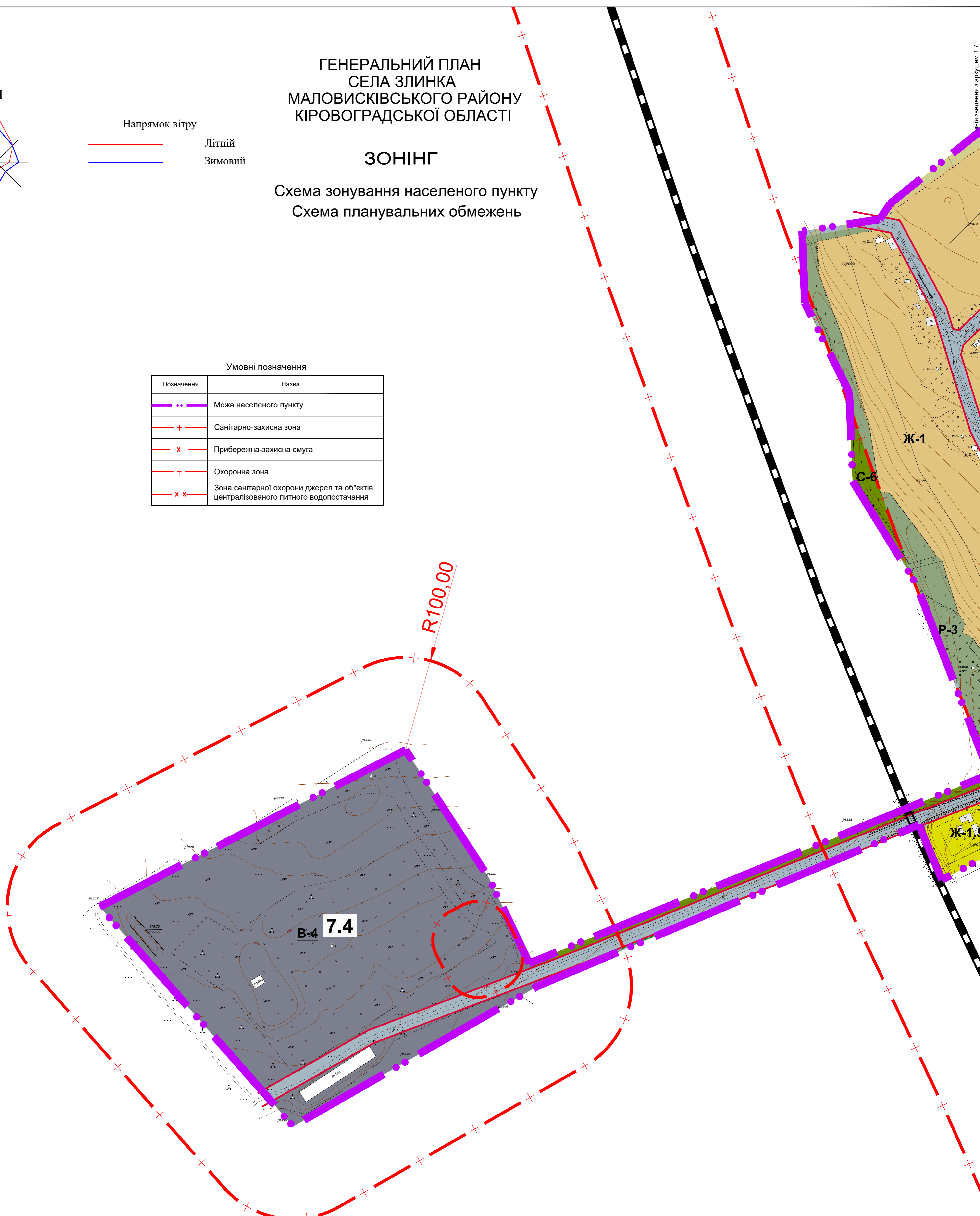
схема розміщення аркушів